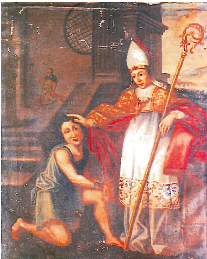
Saint Menoux délivrant un prisonnier

La tradition remonte au VI e siècle et rapporte l'histoire d'un évêque breton ou irlandais mort et inhumé à Mailly sur Rose à son retour de pèlerinage de Rome : SAINT MENOUX.